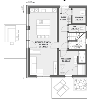
Typenhaus Graz 134 Obergeschoß - Verschiedene Grundrisse möglich!