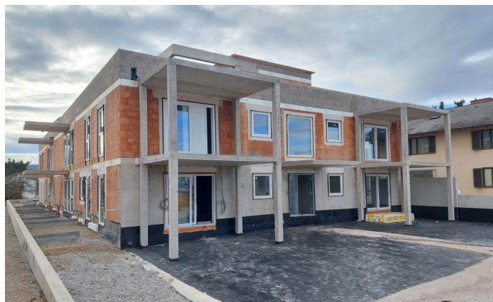
MAUTERN - ROHBAU EIGENTUMSWOHNUNGEN