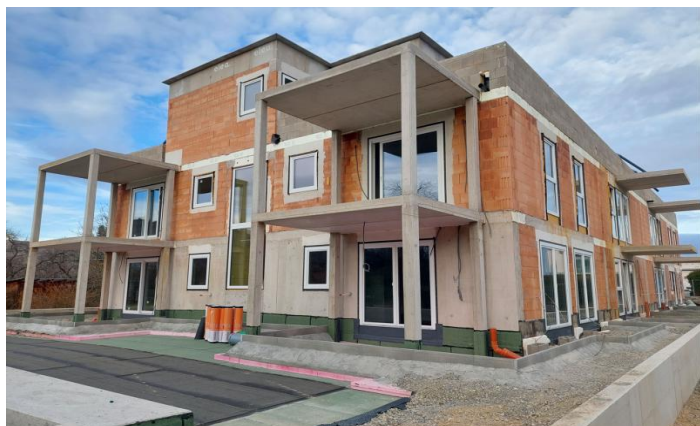
MAUTERN - ROHBAU EIGENTUMSWOHNUNGEN